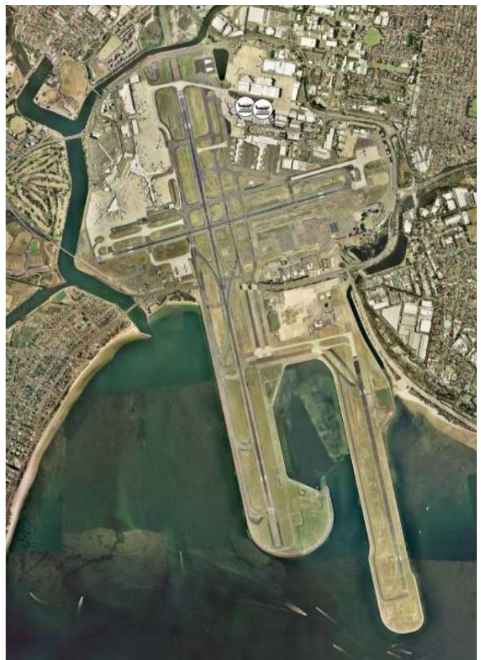
L'aéroport international de Sydney